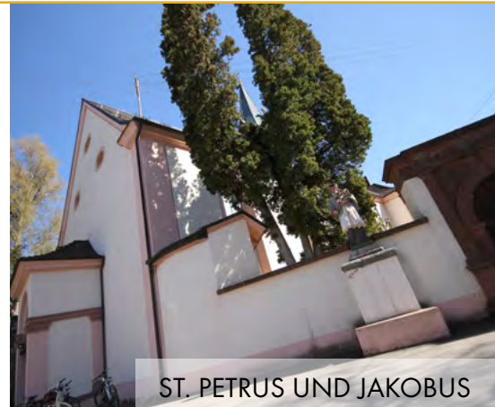
ST. PETRUS UND JAKOBUS