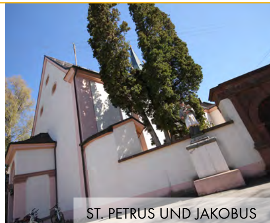
ST. PETRUS UND JAKOBUS

Information Patientenvorsorge „LebensFaden“ N.N. Tel. 07 41 / 24 61 53 stieglirion@ caritas-schwarzwald-alb-donau oder www.lebensfaden.org