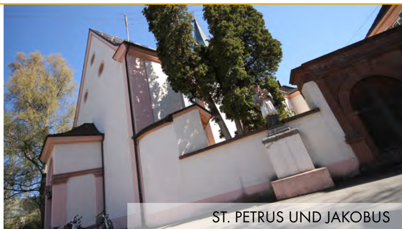
ST. PETRUS UND JAKOBUS

Frau Kochendörfer Mo. 10.00 - 16.00 Uhr und Mi. 13.30 - 17.00 Uhr Tel. 07 41 / 24 61 32 E-Mail: kochendoerfer@caritas-schwarzwald-alb-donau.de oder www.lebensfaden.org