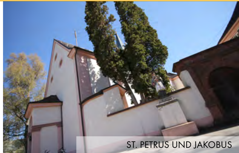
ST. PETRUS UND JAKOBUS

Frau Kochendörfer Mo. 10.00 - 16.00 Uhr und Mi. 13.30 - 17.00 Uhr Tel. 07 41 / 24 61 32 E-Mail: kochendoerfer@caritas-schwarzwald-alb-donau.de oder www.lebensfaden.org