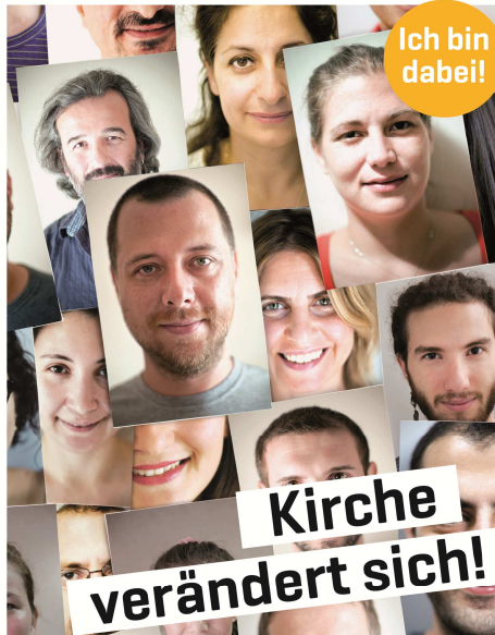
Wahl der Kirchengemeinde- und Pastoralräte · 15. März 2015